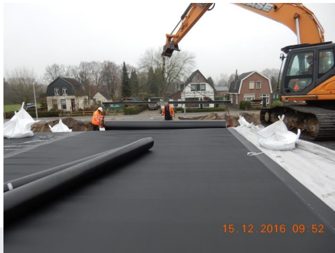
Foto: Aanbrengen HDPE-folie.