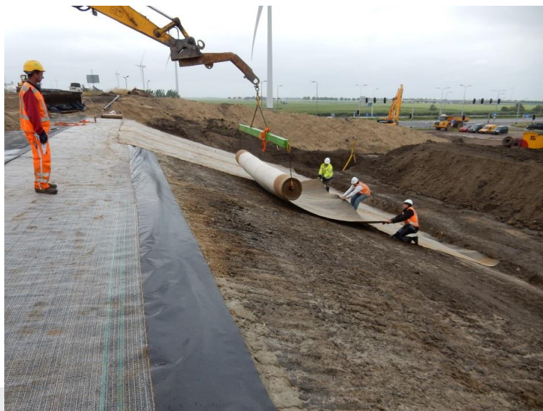
Foto: Toepassing bentonietmat.

Om beschadigingen aan de voorziening te voorkomen, hebben niet-destructieve onderzoeks- en meetmethoden de voorkeur. Methoden die niet in dit protocol zijn voorgeschreven, zijn toegestaan wanneer de inspecteur zich ervan heeft overtuigd dat hij hiermee een betrouwbare kwalificatie van de voorziening kan verkrijgen.