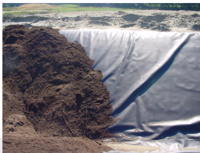
Folie: Belasten wanneer het niet strak ligt (o.a. uitzetting in de zon).