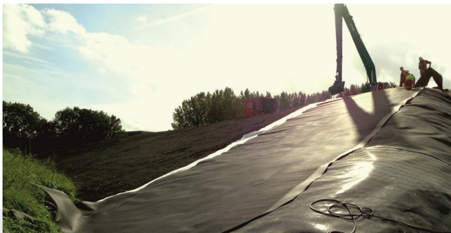
Foto: Overzicht aanleg IBC-werk.