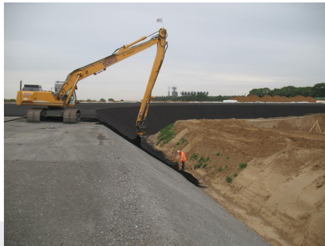
Foto: Aanleg van zandbentonietpolymeergel.