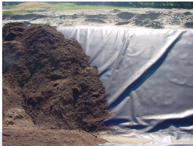
Foto: Folie belasten wanneer het niet strak ligt (o.a. uitzetting in de zon).