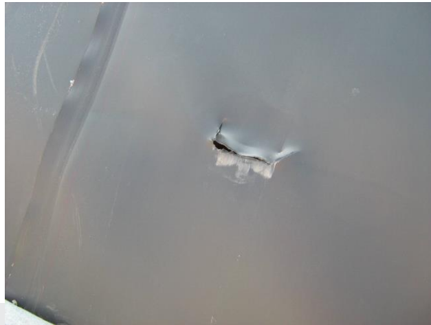
Beschadiging folie.