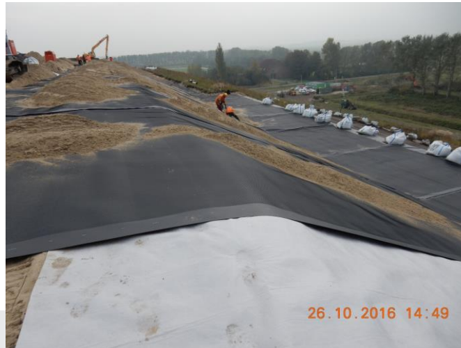
Foto: Aanbrengen geotextiel en HDPE-folie.